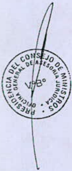
MERCEDES ROSALBA ÁRAOZ FERNÁNDEZ Presidenta del Consejo de Ministros